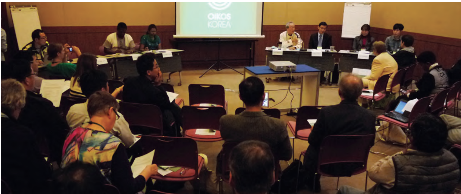
5일 오후 마당 워크숍으로 열린 '생명을 향상하는 문화를 위한 대안적 신학교육'에는 많은 에큐메니칼 신학자들이 참석해 대안 신학교육 운동에 큰 관심을 보였다.