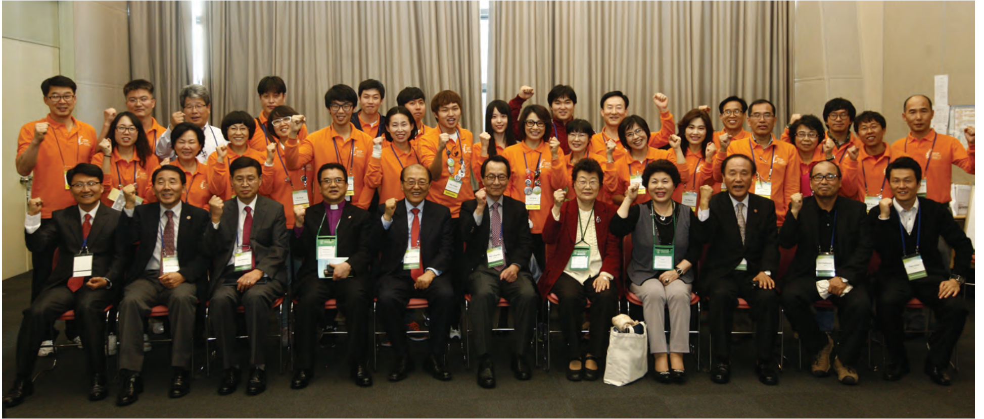
한국준비위원회가 자원봉사자들을 찾아 위로하고 격려했다.

WCC 한국준비위원회(KHC) 관계자들이 5일 WCC 제10차 부산 총회의 성공개최를 위해 땀 흘리며 뛰고 있는 자원봉사자를 찾아 노고를 위로하고, 깊은 감사의 인사를 전했다.