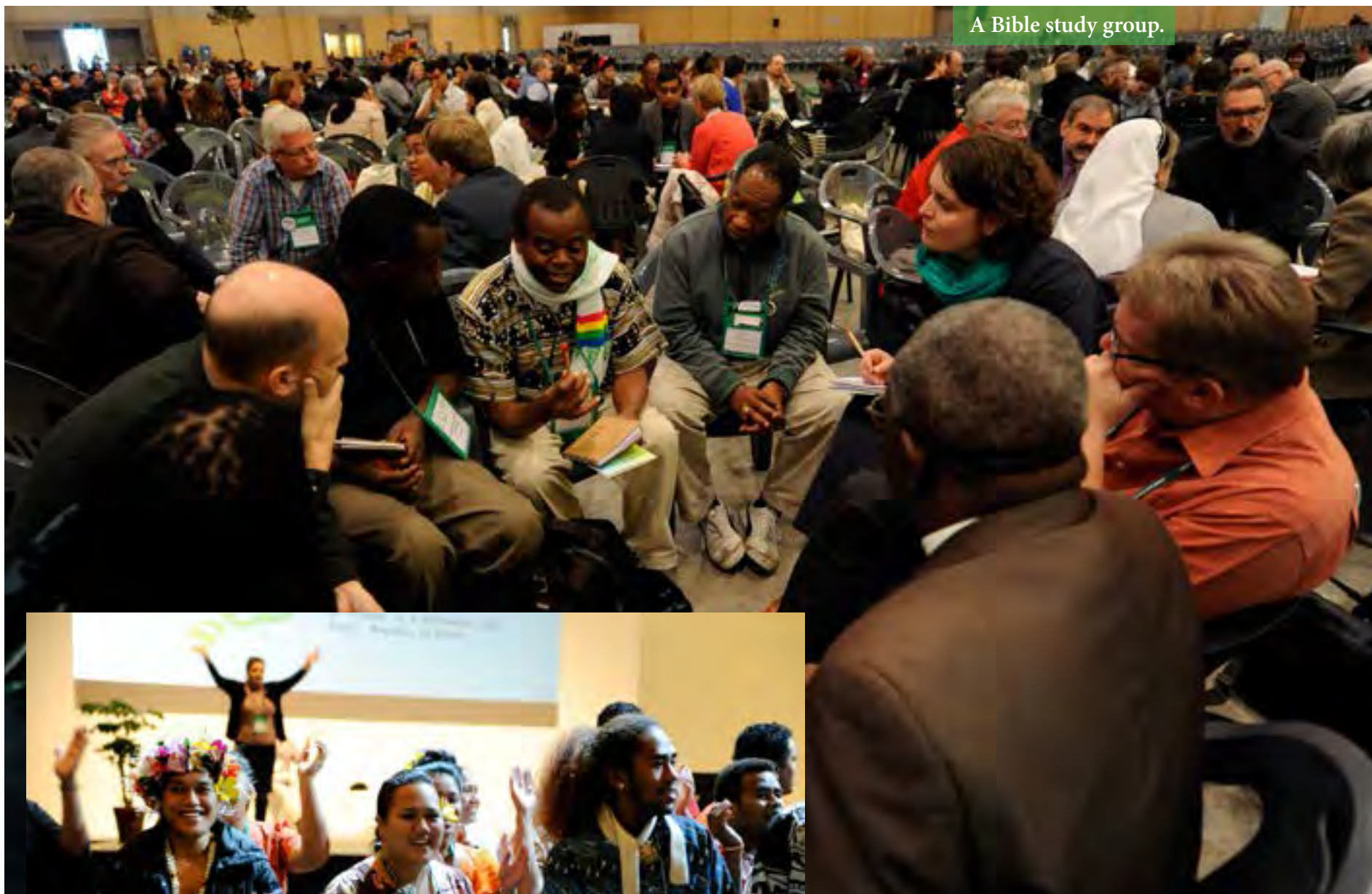
A Bible study group.