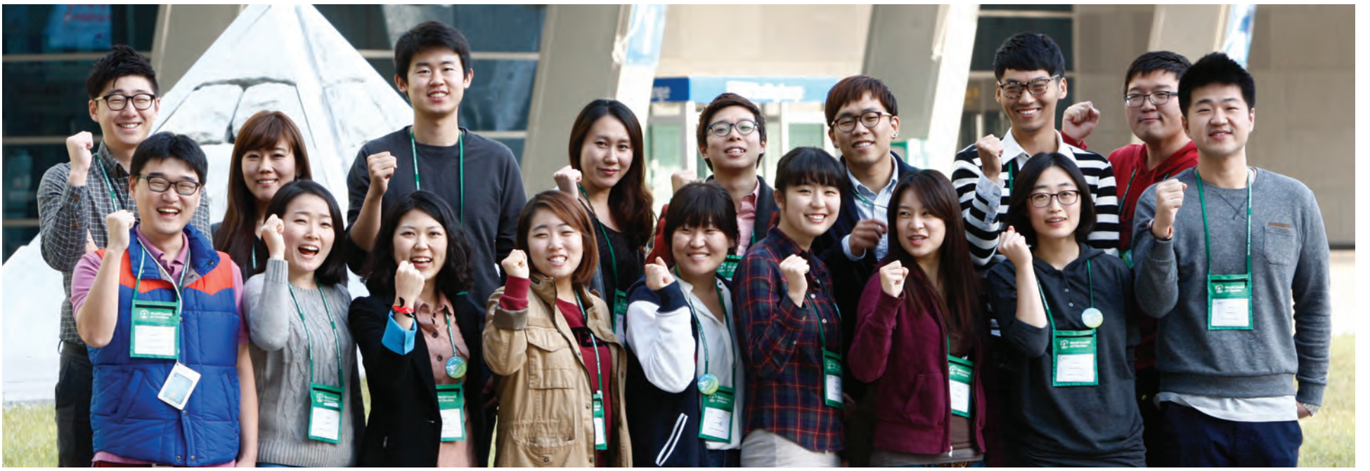
미래 에큐메니칼 운동에 헌신할 청년 스튜어드들이 한 자리에 모여 대회의 성공을 위한 헌신을 다짐했다.