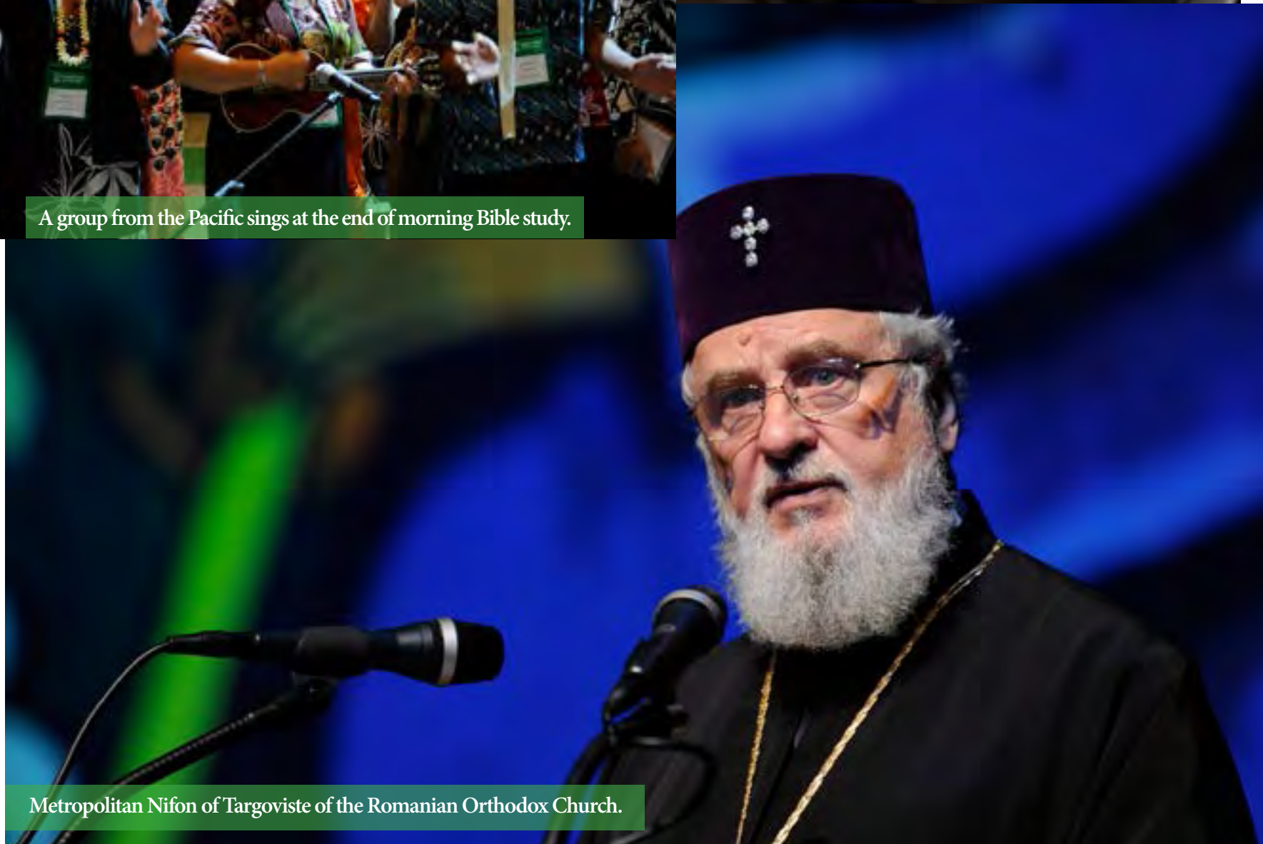
Metropolitan Nifon of Targoviste of the Romanian Orthodox Church.