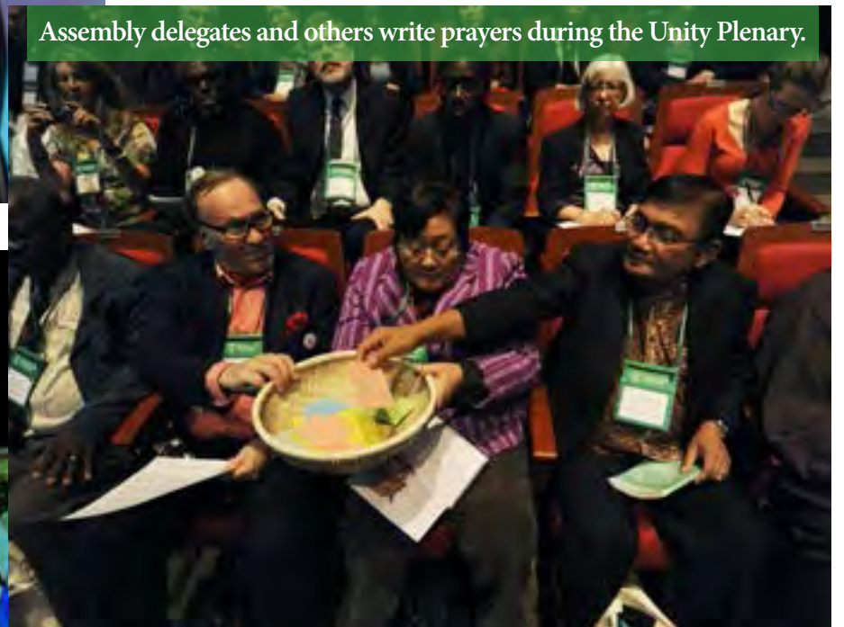
Assembly delegates and others write prayers during the Unity Plenary.