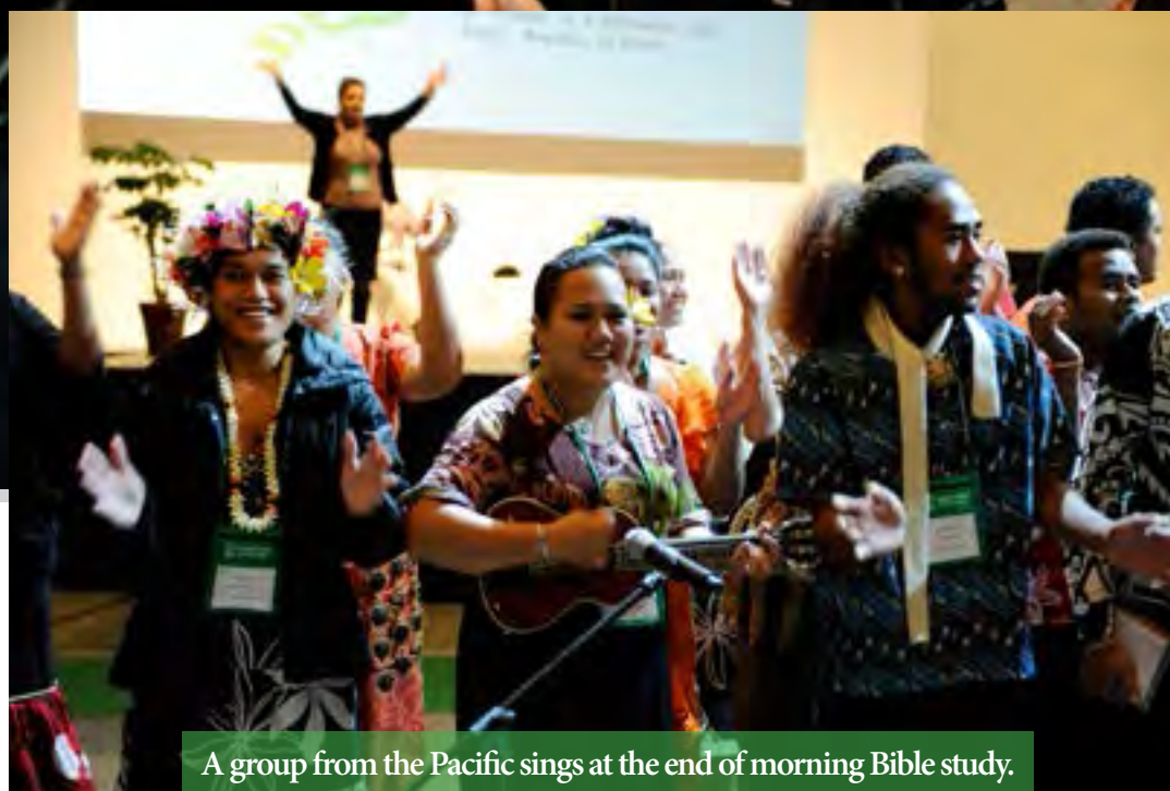
A group from the Pacific sings at the end of morning Bible study.