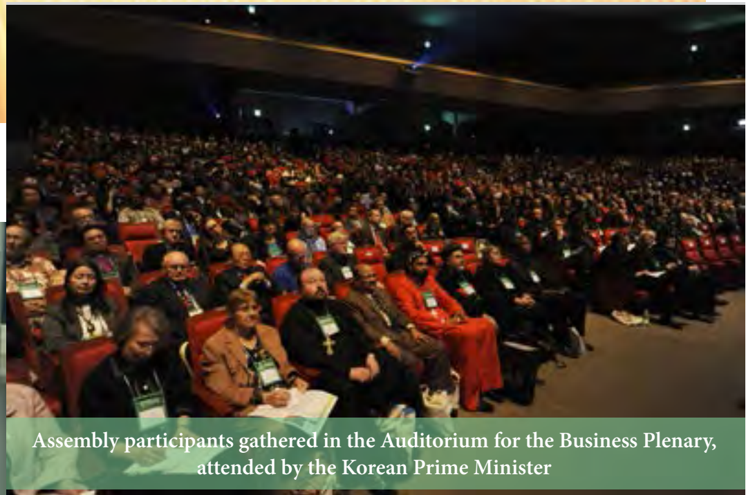
Assembly participants gathered in the Auditorium for the Business Plenary, attended by the Korean Prime Minister