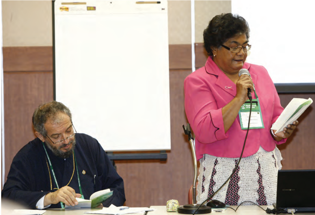
제10차 총회는 개막일과 폐막일 그리고 주말프로그램을 제외한 매일 오전 성경 공부가 진행된다.