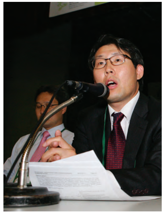
에큐메니칼 좌담은 WCC 총회의 여러 일정 중에서도 중요한 의미를 지니고 있다.