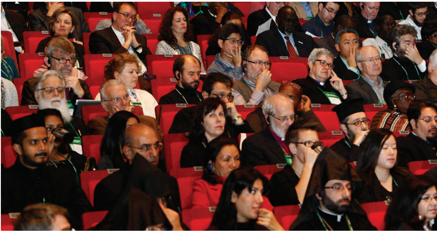
지난 10월 31일 열린 주제회의에서는 총회 주제에 대한 지구적, 상황적, 신학적 차원의 성찰을 담은 발제가 진행됐다.