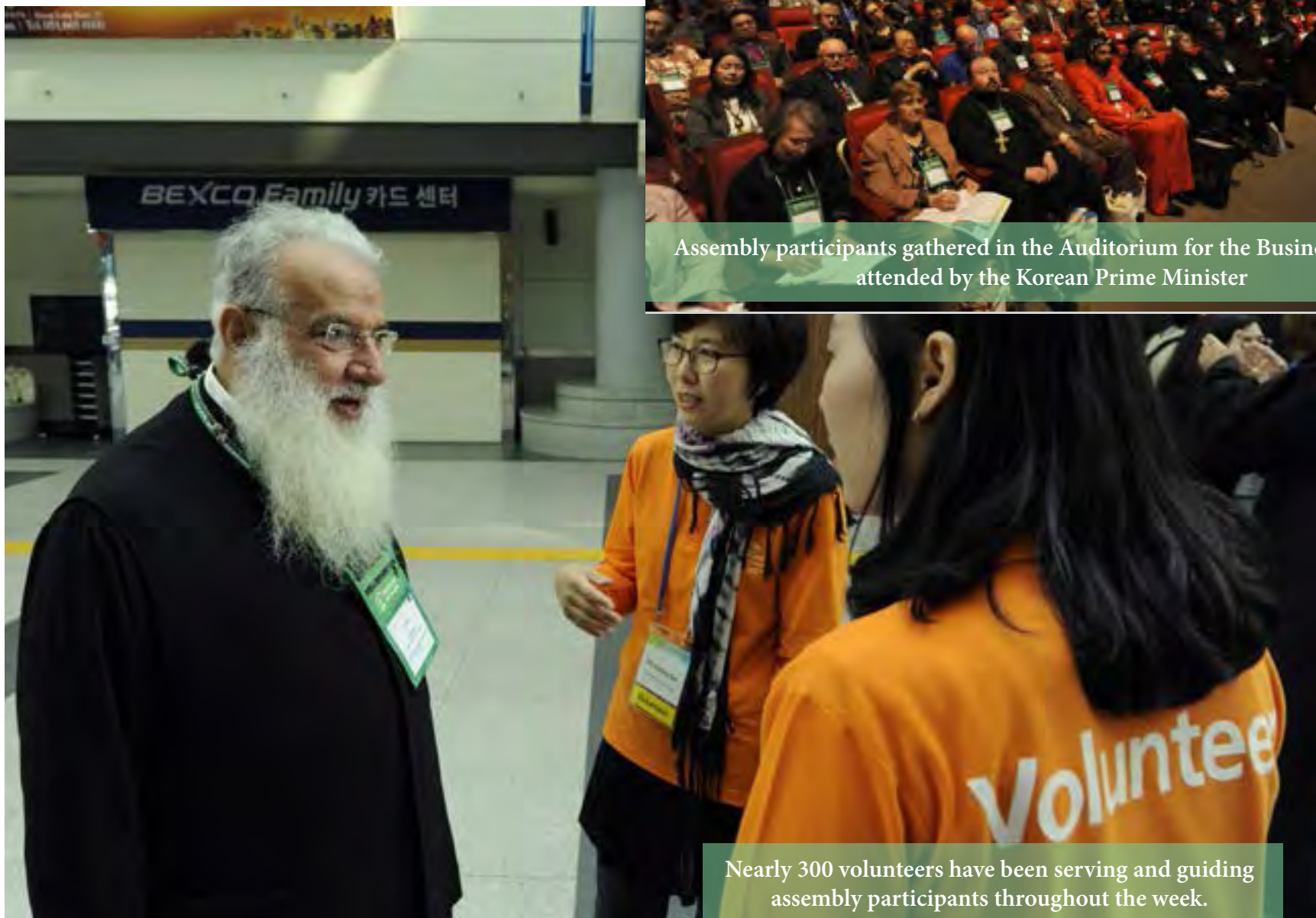
Nearly 300 volunteers have been serving and guiding assembly participants throughout the week.