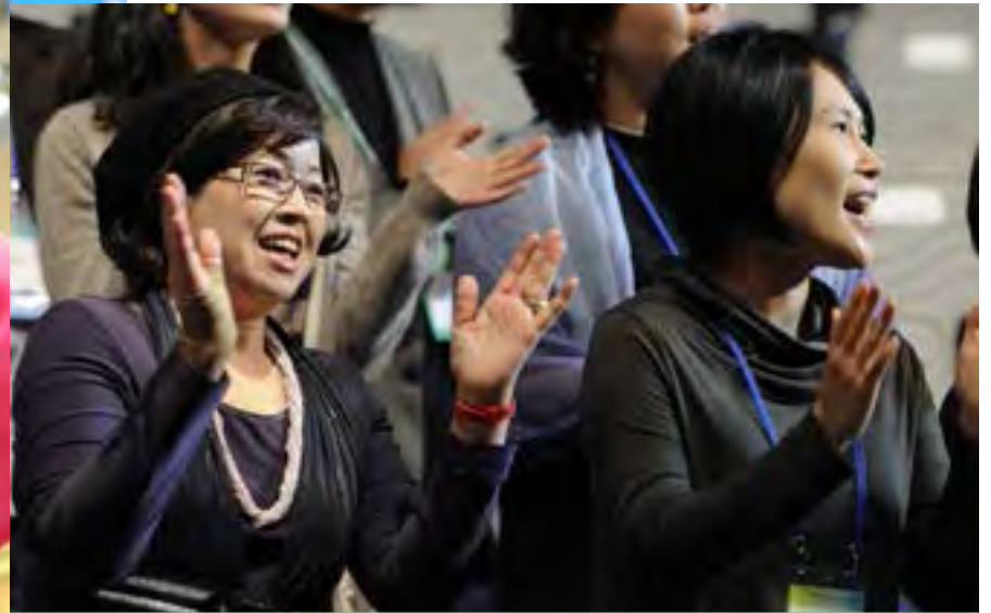
Worship times at the assembly have brought fulfilment to spiritual fulfilment and joy to many.