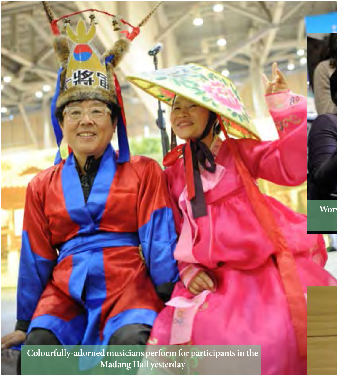
Colourfully-adorned musicians perform for participants in the Madang Hall yesterday