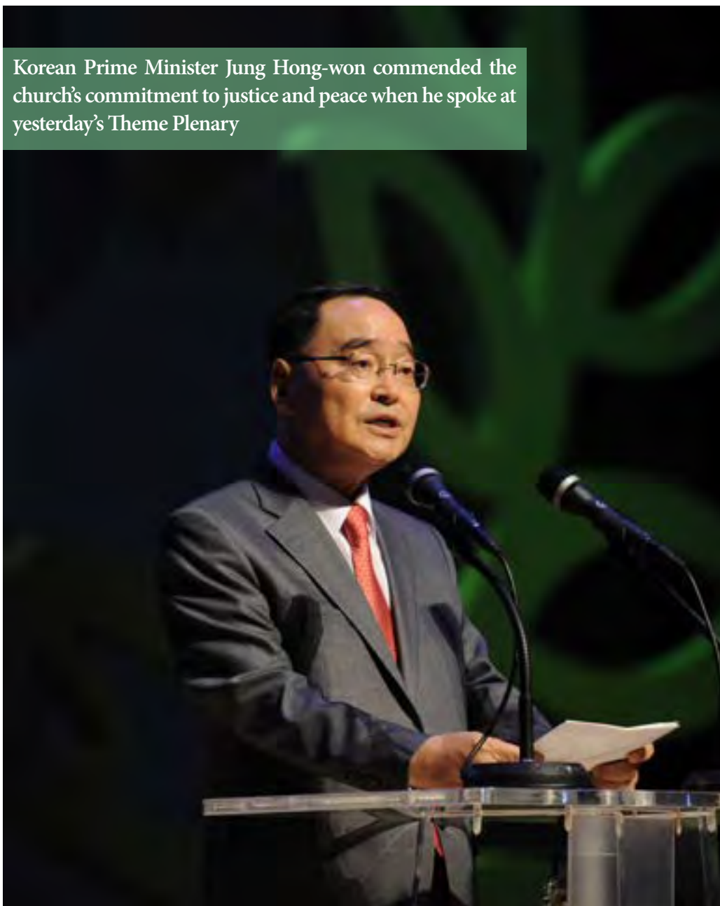
Korean Prime Minister Jung Hong-won commended the church's commitment to justice and peace when he spoke at yesterday's Theme Plenary