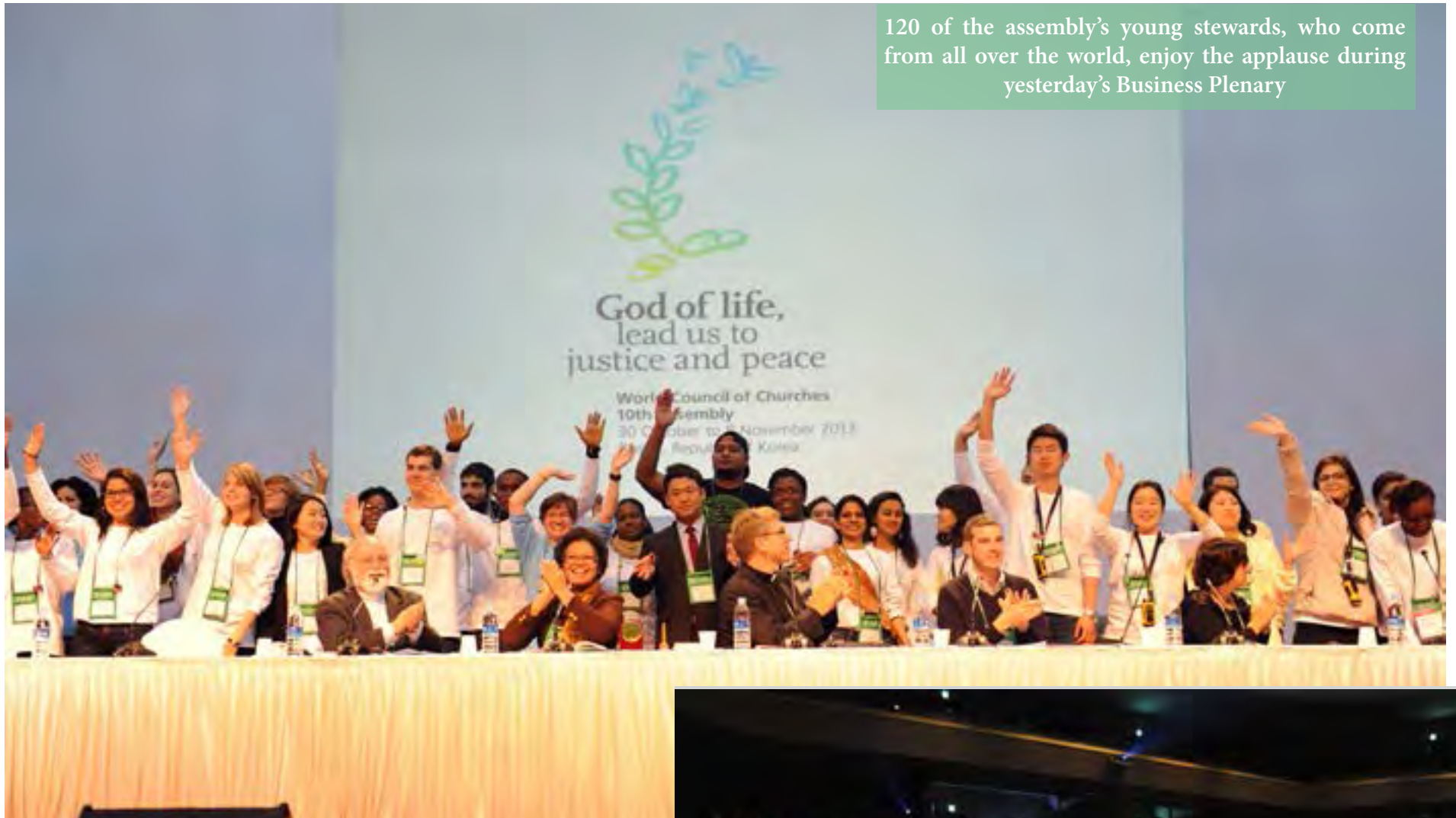
120 of the assembly's young stewards, who come from all over the world, enjoy the applause during yesterday's Business Plenary